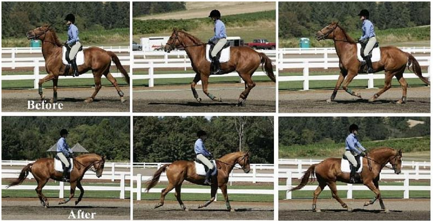
Porównanie zachowania konia na zwykłym wędzidle (górny wiersz) oraz na wędzidle Myler'a (dolne zdjęcia)

Można uczestniczyć w klinice z koniem lub jako słuchacz.